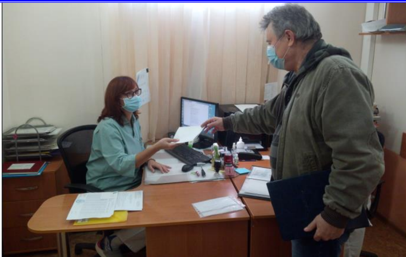
Начальник штаба тренировки вручает конверт с вводной дежурному врачу кабинета медицинского освидетельствования.