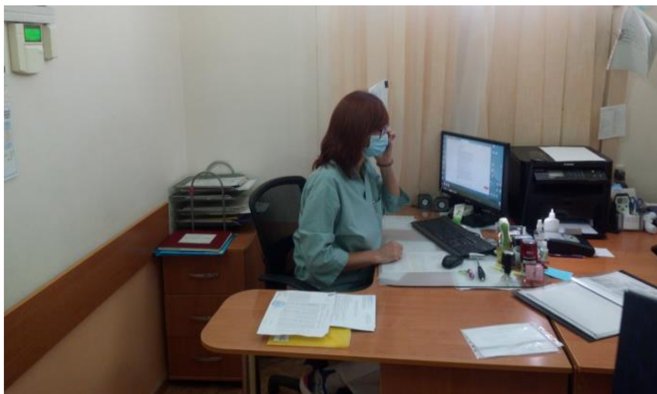
Дежурный врач кабинета медицинского освидетельствования докладывает главному врачу ГБУЗ РК «КНПЦН» на получение сигнала «Сбор» и начала отработки плана тренировки