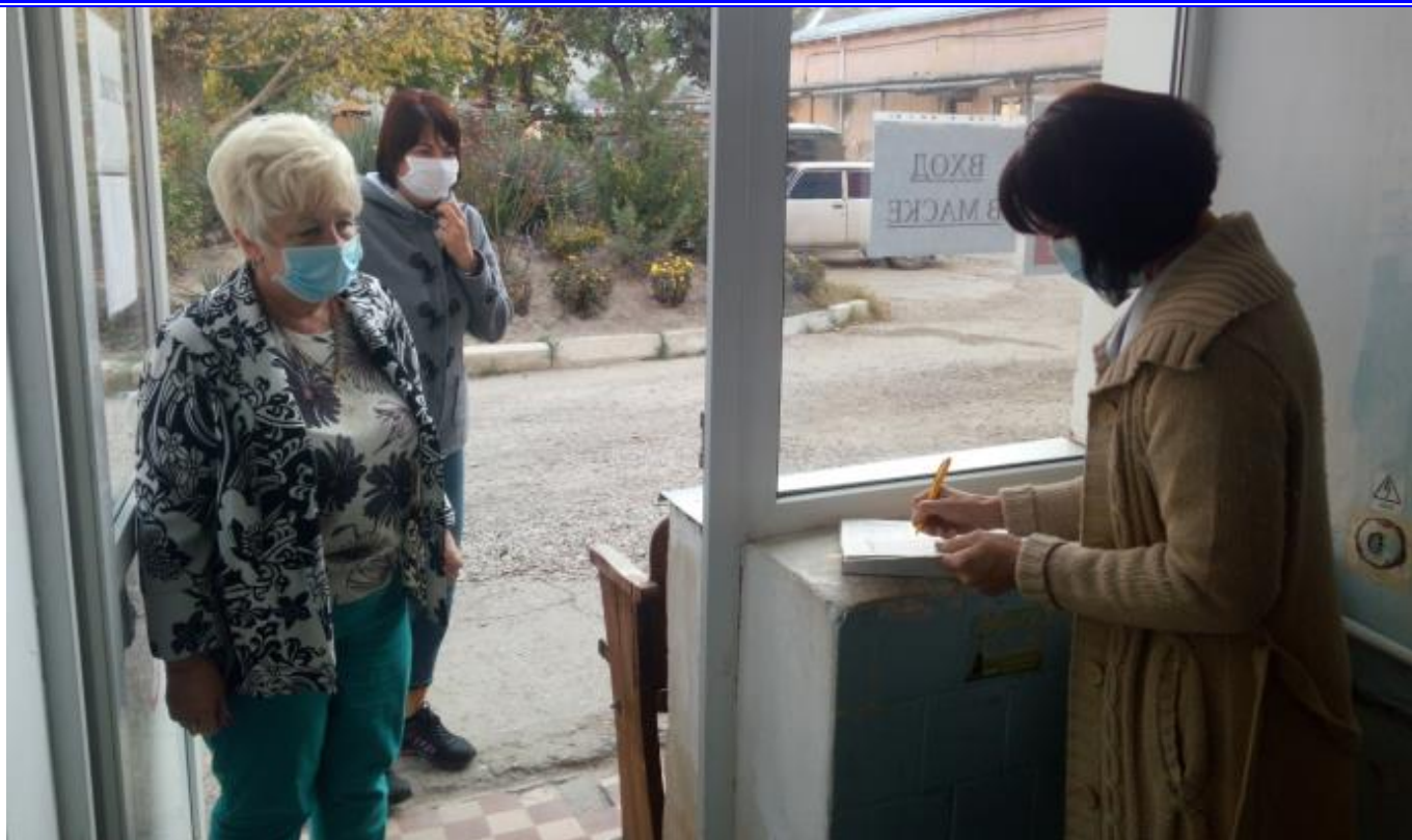
Старшая медицинская сестра диспансерного отделения отмечает прибывших по сигналу «Сбор»