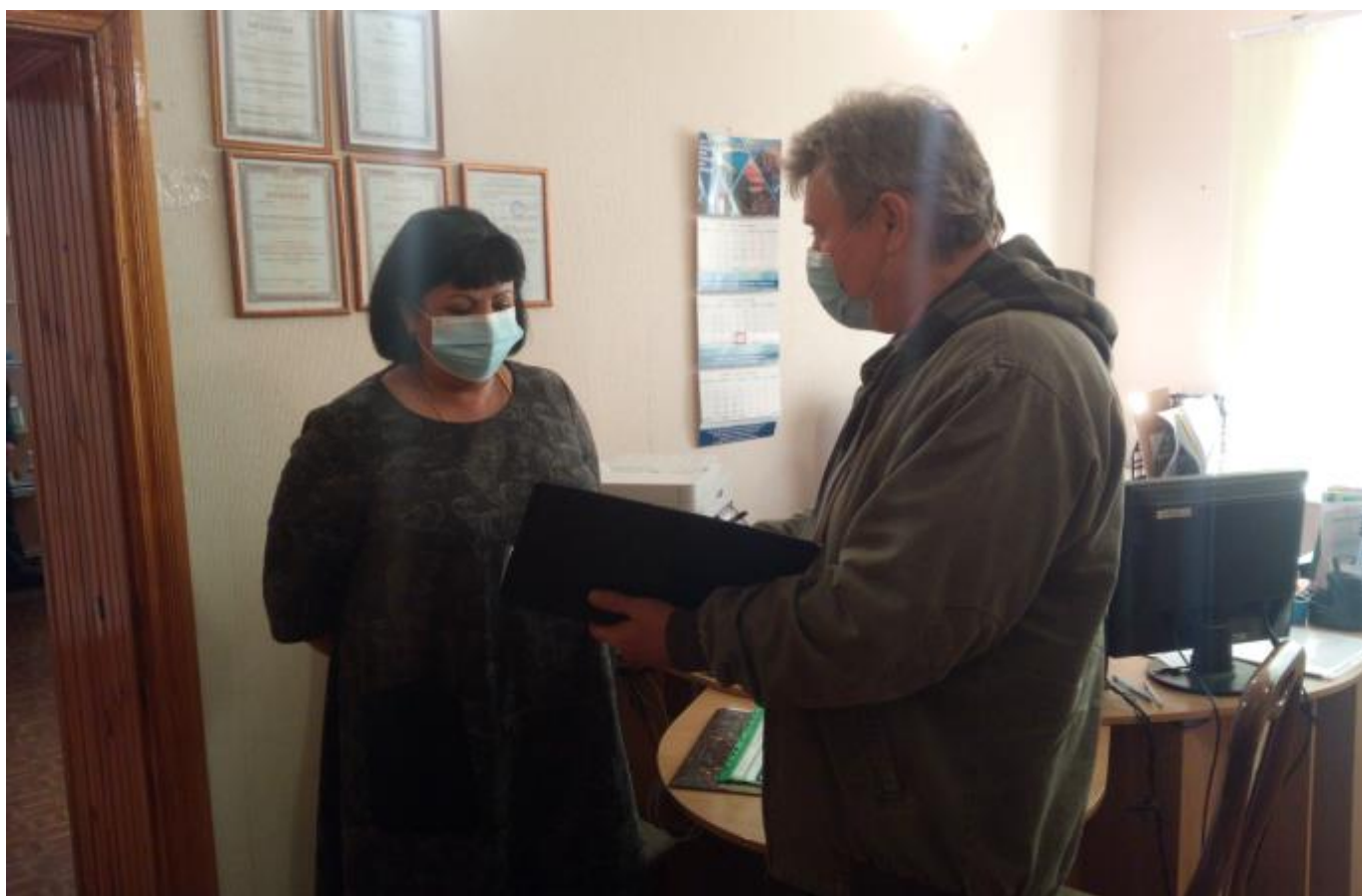
Начальник штаба тренировки докладывает результаты тренировки заместителю руководителя тренировки.